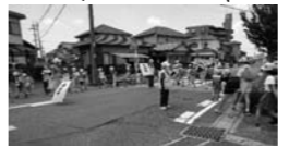
下校時に見守り隊の人と児童がマスクを着用する様子

問 コロナ感染拡大と大震災等の自然災害が同時に発生した場合の対策は。 答 感染リスクが想定されるので、自宅の方が安全であれば在宅避難を基本としてHPや広報で周知する。台風や豪雨など短期の避難は自宅2階への垂直避難や親戚宅等への水平避難を推奨。避難所では問診票の作成、検温して問仕切り。地震など長期の避難は体育館や教室が3密にならないよう、他の公共施設も避難場所として拡大する。 問 財政調整基金と地方交付税について 答 コロナ対策で財政調整基金（貯金）をどの程度取り崩せるか。臨時財政対策債を借りずに運営するのが適当なのか。 問 大規模災害発生と同等と考え、対策事業ごとに基金を取り崩す。交付税は需要額と収入額の差額不足分が交付される。 問 歩行者第一のまちのPR、また横断歩道で停車しない車の対策は。 答 警察、市内企業と連携しキャンペーンを始めた。愛知署への取り締まりの依頼は可能と考える。 問 夏休みが短縮される。児童生徒の登下校時のマスク着用は義務か。熱中症対策のため冷やしマスクや日傘の配布は。また、見守り隊の人への支援は。 答 間隔を取って、3密を避けて下校させるが、マスクは体調に合わせ外してもよい。日傘や冷やしマスクは有効と考える。（市長）見守り隊へは、保冷マスクか、かぶり傘かで方向性を決めたい。 問 登下校時の安全確保 答 警察、市内企業と連携しキャンペーンを始めた。愛知署への取り締まりの依頼は可能と考える。 問 夏休みが短縮される。児童生徒の登下校時のマスク着用は義務か。熱中症対策のため冷やしマスクや日傘の配布は。また、見守り隊の人への支援は。 答 間隔を取って、3密を避けて下校させるが、マスクは体調に合わせ外してもよい。日傘や冷やしマスクは有効と考える。（市長）見守り隊へは、保冷マスクか、かぶり傘かで方向性を決めたい。