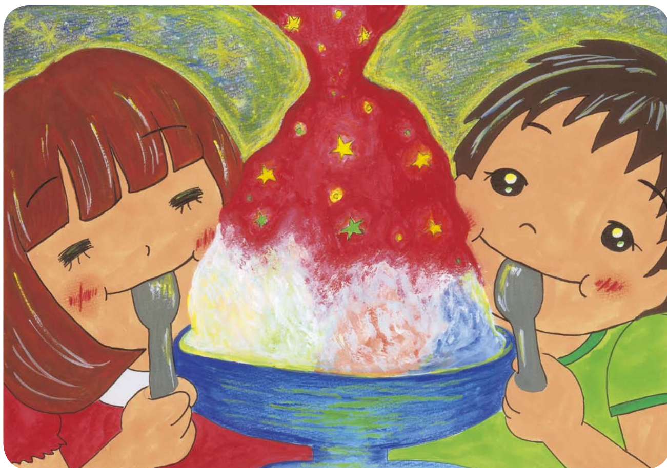
「豊明の夜空のかき氷の味」 絵画 泉 カンナ(ペンネーム)