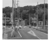
徳田前交差点で中斷（桜ヶ丘沓掛線）