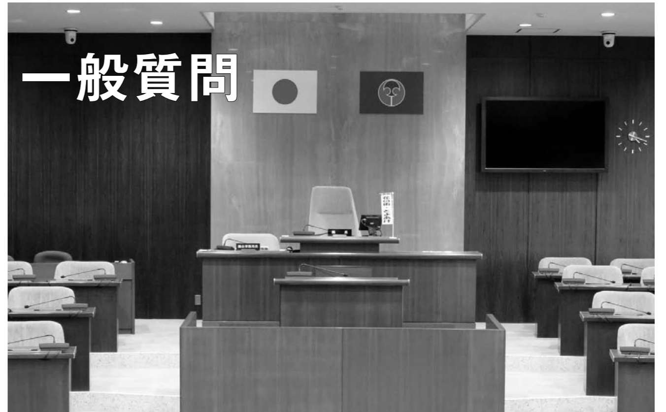
行政のいろいろな問題や施策に対する考え方について10名の議員が質問に立ちました。その内容については次のとおりです。（文責は各議員にあります。）