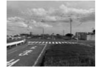
暫定道路から刈谷方面を望む（名古屋岡崎線）

問 令和2年3月28日、名古屋岡崎線の豊田安城工区の開通式があった。これで未開通は刈谷市と豊明市だけになった。刈谷工区は既に工事中である。豊明工区はなぜ整備が始まらないのか。 答 豊明市内の道路整備は既に始まっている。豊明刈谷工区は令和元年度から用地買収が始まり、令和7年度に境川の橋梁の完成を目標として標記している。境川から小所の暫定道路も令和元年度から用地買収を始め、令和7年度の完成を目標としている。沓掛町の勅使交差点から沓掛町の明和交差点までの豊明中央工区は今年度より事業着手し、現在は測量を含めた予備設計の状態である。開通時期は未定。