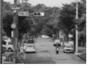
二村山緑地で中斷（平手豊明線）

問 平手豊明線と大根若王子線が交差する二村山緑地の見直し時期はいつになるのか。 答 令和8年度までの間に二村山緑地と隣接する都市計画道路の見直しを調査検討する。 問 大根若王子線の今後の整備見直しは。 答 春木沓掛線から名古屋岡崎線との接続を優先しており、西部保育園から敷田大久伝線の交差点区間の計画は現在のところない。 問 桜ヶ丘沓掛線の春木沓掛線徳田前交差点から名古屋岡崎線までの整備計画は。 答 今年度予備設計を発注、その後、詳細設計、境界確定、用地買収、工事の順で進める。開通時期は名古屋岡崎線と同時にとなる。